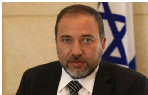
Avigdor Liberman MRE de Israel